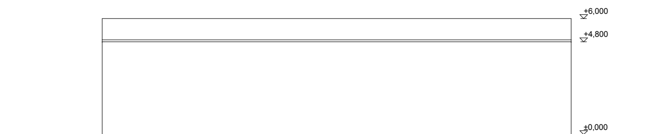
VAADE LOODEST M 1:200